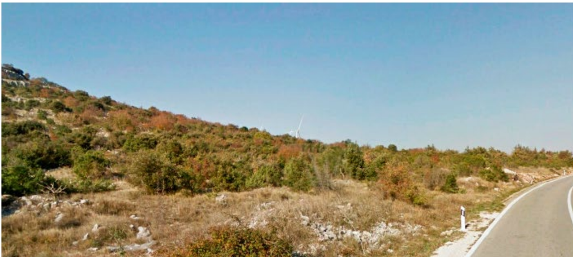
Slika 5.11-11 Pogled na VE Dazlina s D27 pokraj Oštarija (točka 9)