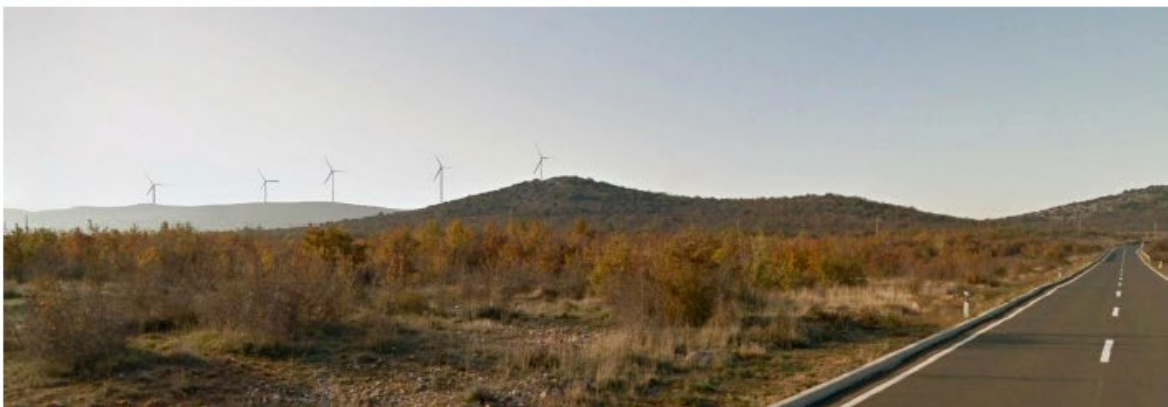
| Slika 5.11-7 Pogled na VE Dazlina s D59 (pogled 1) (točka 5)