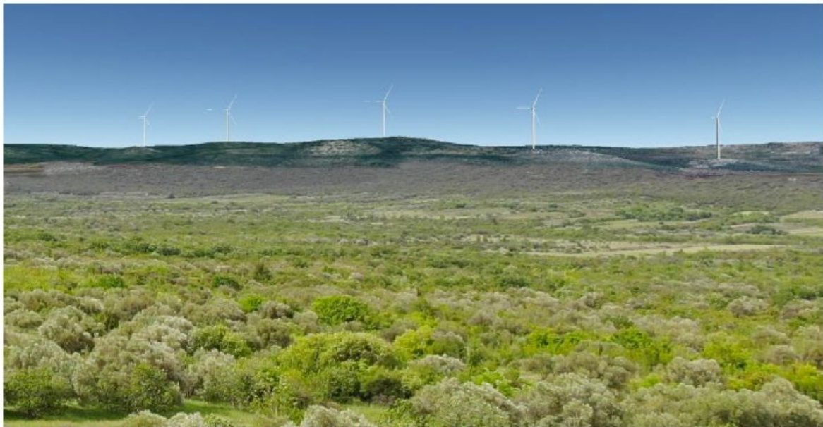
Slika 5.11-18 Pogled na VE Dazlina iz mjesta Burići (točka 16)