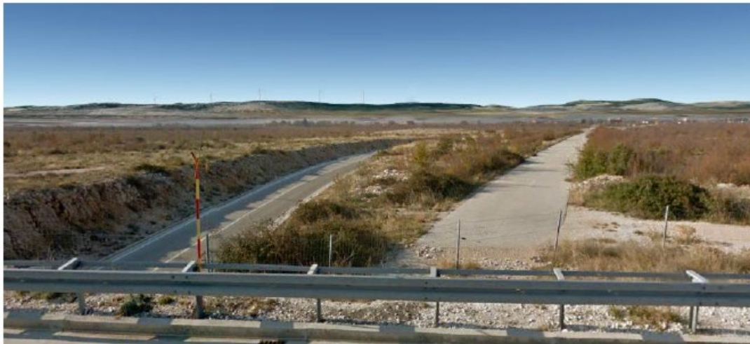
Slika 5.11-3 Pogled na VE Dazlina s A1 (točka 1)