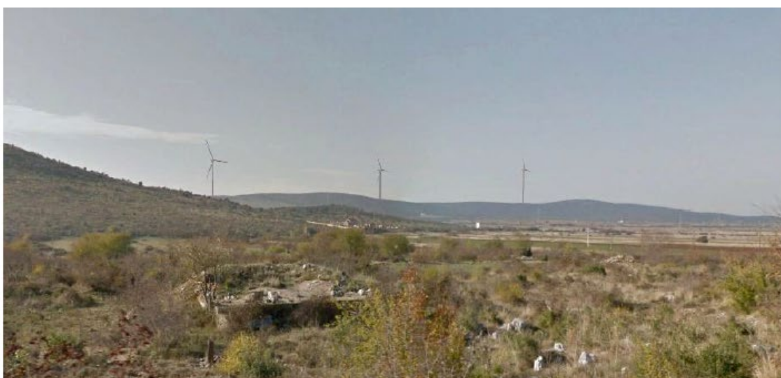
Slika 5.11-9 Pogled na VE Dazlina iz mjesta Dragišići (točka 7)