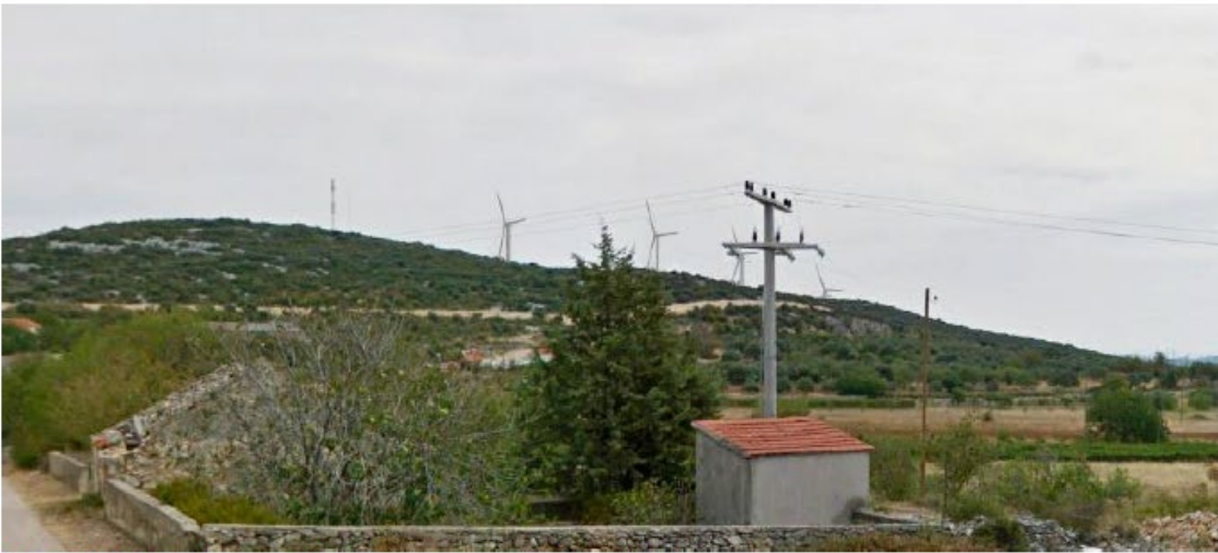
Slika 5.11-15 Pogled na VE Dazlina iz mjesta Putičanje (točka 13)