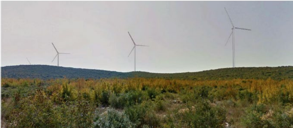
Slika 5.11-14 Pogled na VE Dazlina s ceste D27 između Grabovaca i industrijske zone u Stankovcima (točka 12)