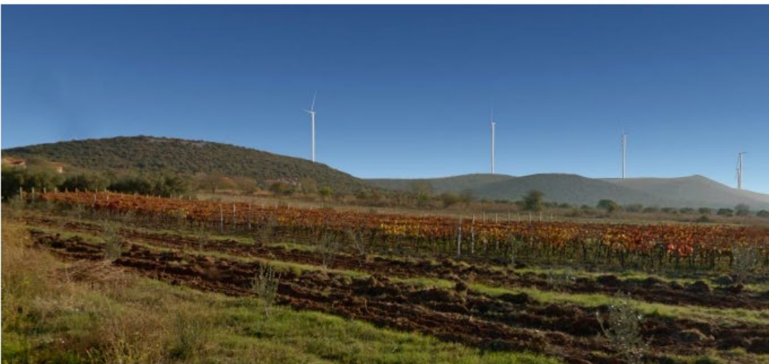
Slika 5.11-16 Pogled na VE Dazlina s ceste D59 pokraj Muića (točka 14)