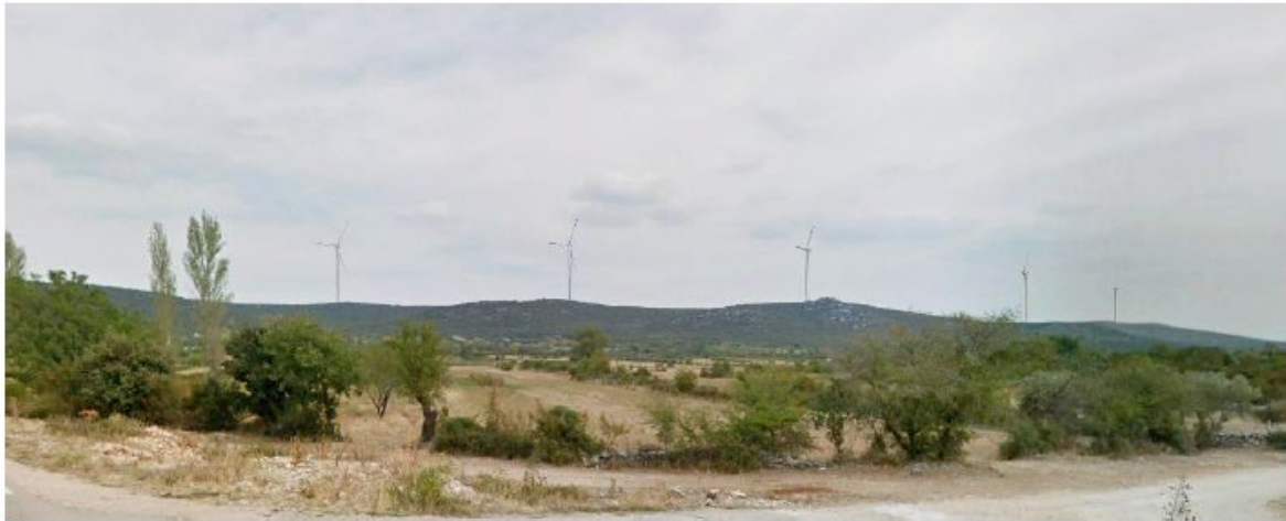
Slika 5.11-17 Pogled na VE Dazlina iz mjesta Dazlina (točka 15)