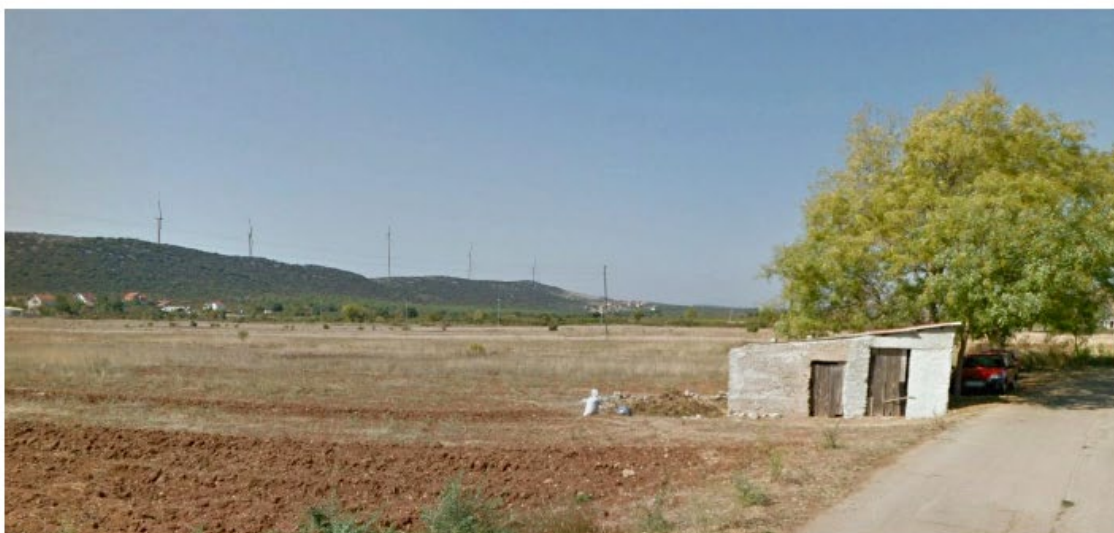
Slika 5.11-10 Pogled na VE Dazlina iz mjesta Gaćelezi (točka 8)