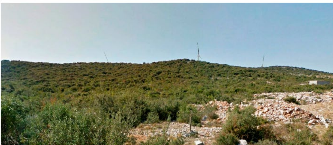
Slika 5.11-12 Pogled na VE Dazlina iz mjesta Grabovci 1 s ceste D27 (pogled 1) (točka 10)