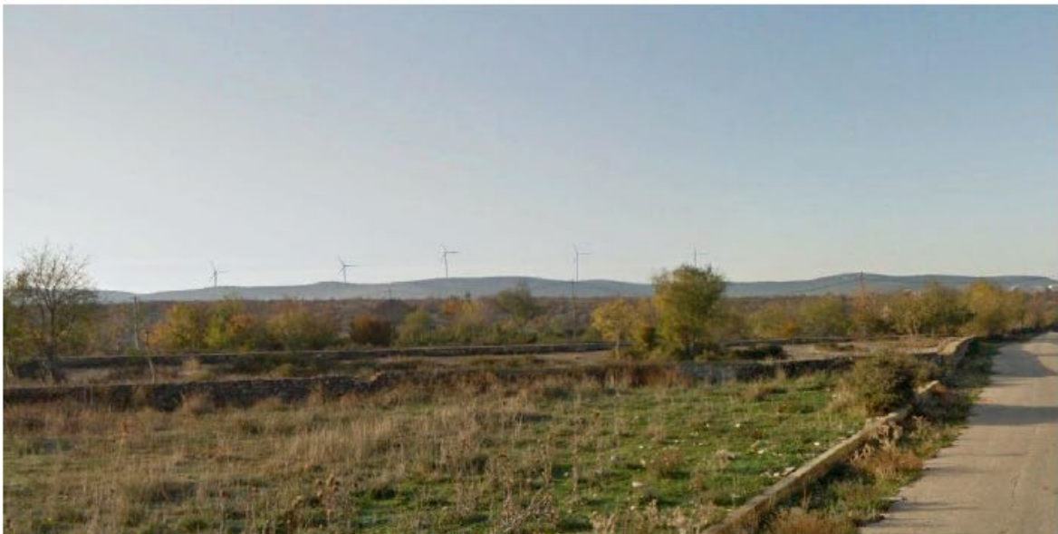
| Slika 5.11-6 Pogled na VE Dazlina iz mjesta Čista Mala (točka 4)