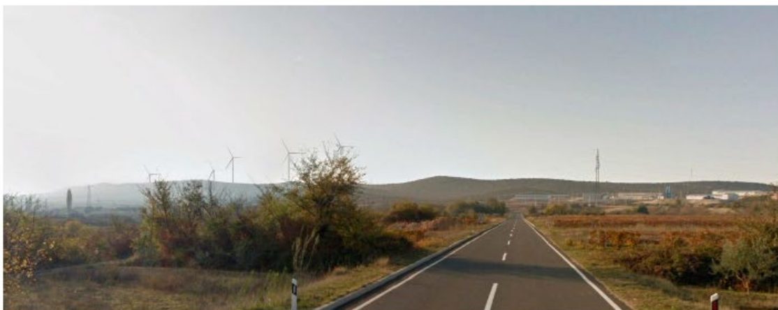
Slika 5.11-8 Pogled na VE Dazlina s D59 (pogled 2) (točka 6)