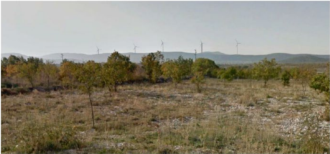
| Slika 5.11-5 Pogled na VE Dazlina iz mjesta Čista Velika (točka 3)