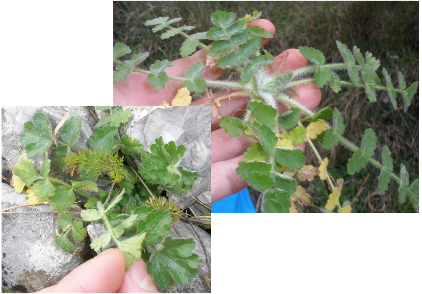
Mačja muda ( Tordylium apulum L., veliki mačak, babino sito, vratizelj, troprezna orjašica)