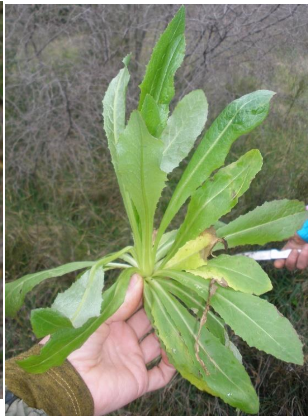
Divlja salata ( Lactuca virosa - L.)