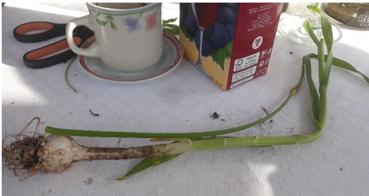
Dibji luk ( Allium porrum L. perić luk, prasluk, por, poljski češnjak, naljutka, praziluk, pernati luk, porjak, purjak)