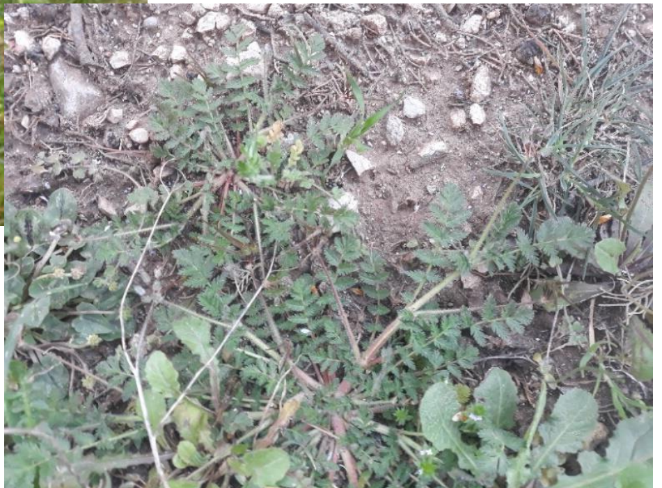
Jaglica ( Erodium cicutarium L. Her, Geraniaceae . Capljan, iglica )