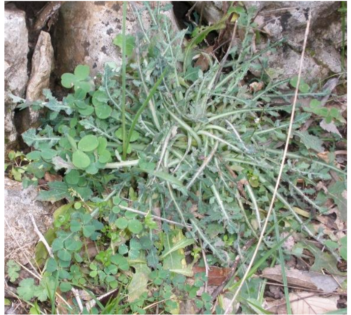
Guc ( Reichardia picroides L. Sredozemna bršaka, gudac, Domac, kozjača, materica, jaguc, jagla, materodica, obična krasena, brsača)