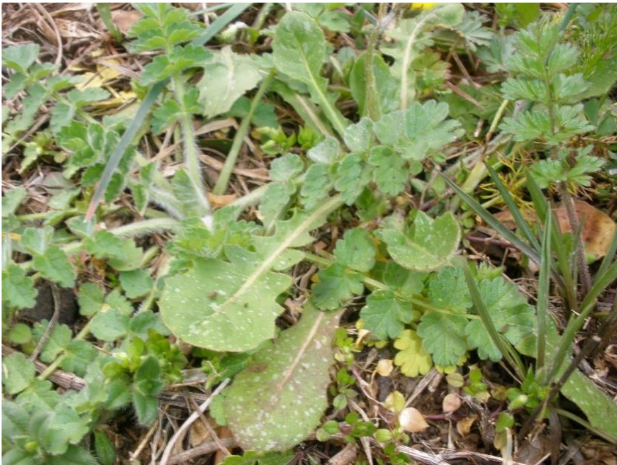
Pupavica ( Crepis sancta L. zečevac, rascijepani dimak, sveti dimak, dimak)