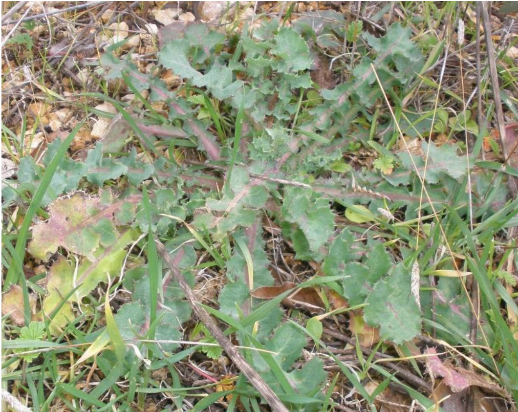
Svinjak ( Sonchus oleraceus L., kostriš, zeljasti ostak, masni kostriš, kostrič, kostriječ, zečja salata, gorčika, mlječec, čepčežac, krlič, mlečac, ripilica, kuk, blišnjakin)