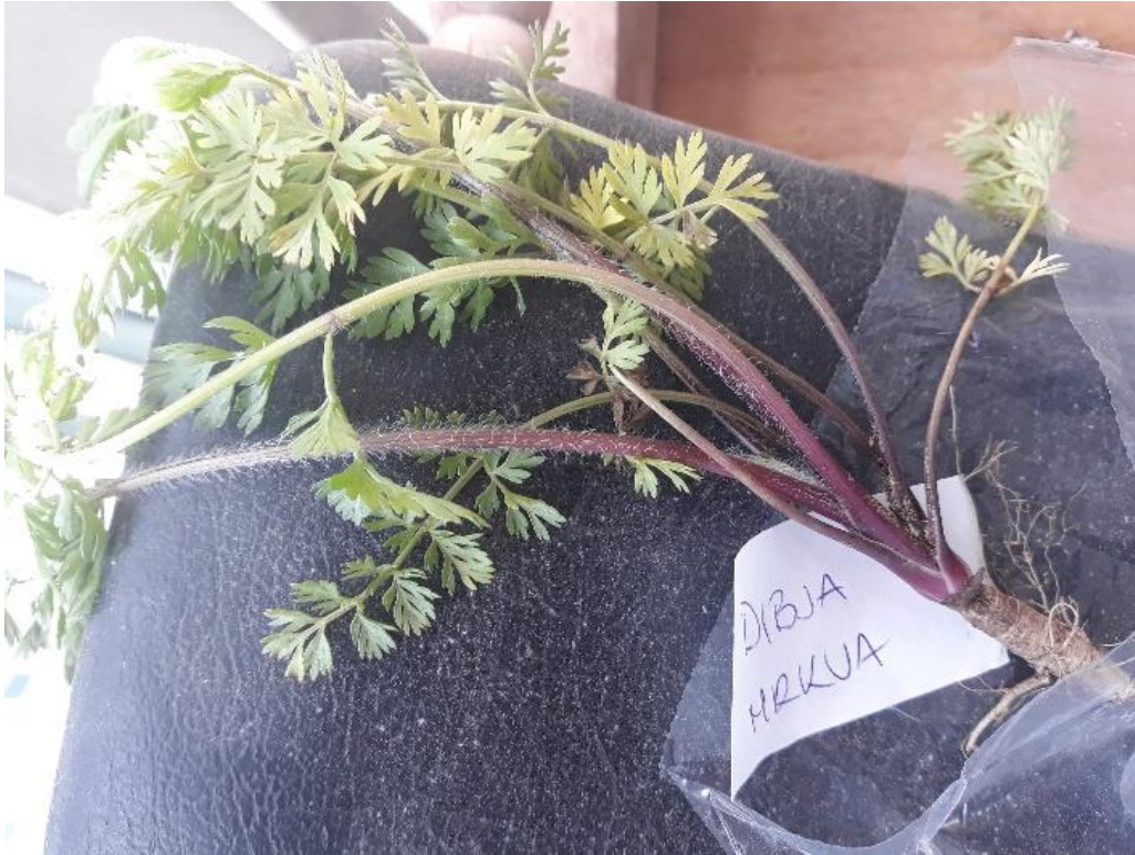
Dibja mrkva ( Daucus carota L. ssp. carota )