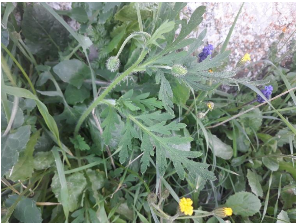
Mak ( Papaver rhoeas L. mak turčinak)