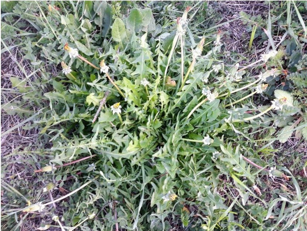
Maslačak ( Taraxacum officinale , Weber, Asteraceae)