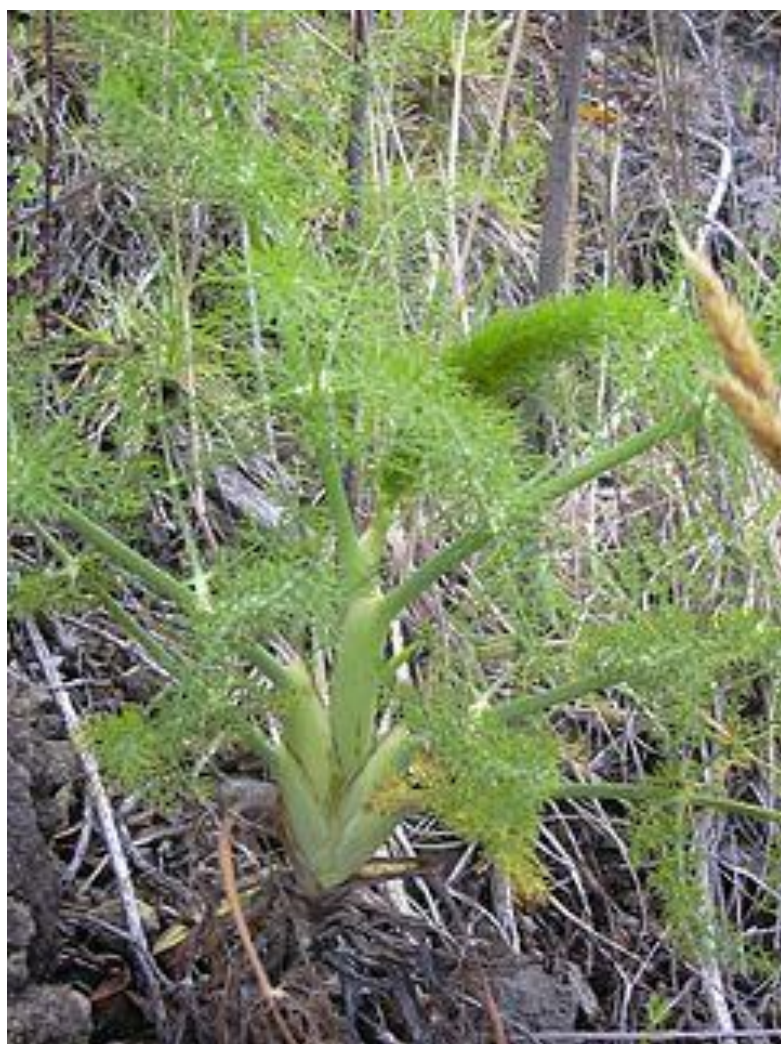
Koromač ( Foeniculum vulgare Mill., komorač)