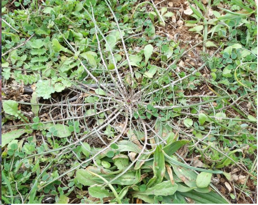
Kozja brada ( Tragopogon tommasinii L., Tomasinijeva kozja brada )