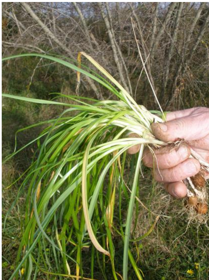
Pazdej – jedna vrsta divljeg luka, miriši ko vlasac stavlja se u „vodiško kulenje“, u Imotskom zbon)