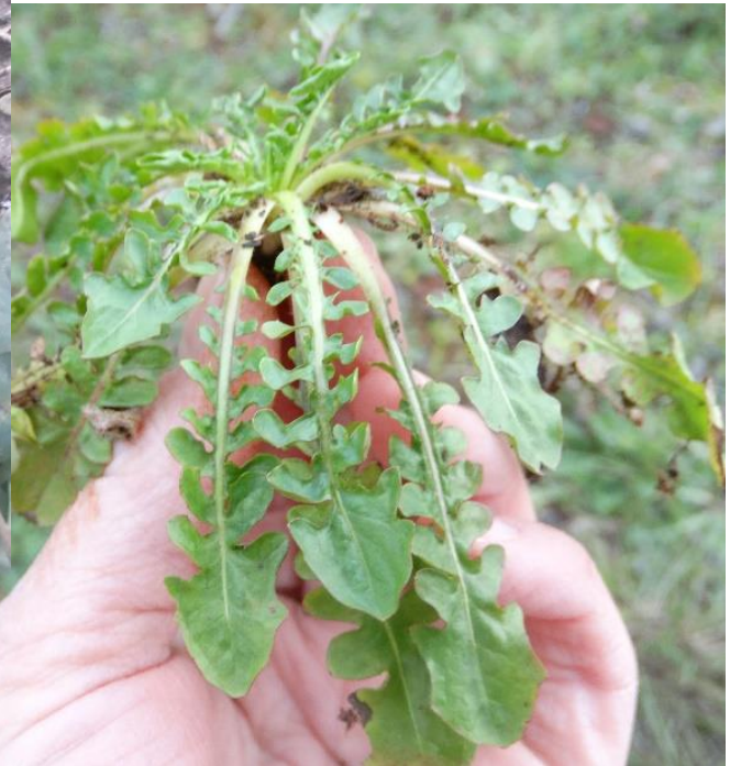
Tustača ( Diplotaxis eruroides , L. Brassicaceae, dvoredac, nadimaca)